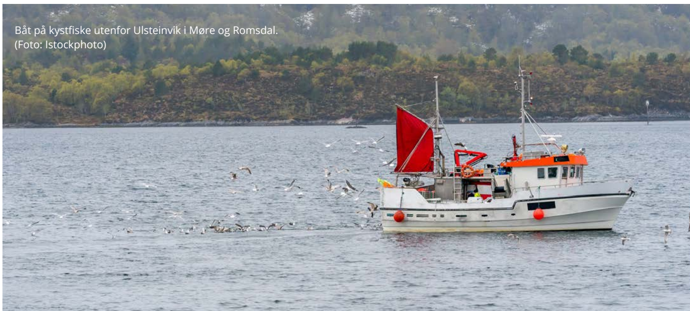
Båt på kystfiske utenfor Ulsteinvik i Møre og Romsdal.

Kvinnens viktige historiske rolle i fiskeri fikk økt oppmerksomhet blant kvinneforskere på 1970- og 80-tallet. Begreper som «det skjulte fisket» og «bakkemannskap» ble lansert for å synliggjøre det viktige arbeidet kvinner gjorde på land for fisket. Kvinner understøttet mennenes aktiviteter som fisker gjennom ulønna arbeid i hjemmet, med produksjon av mat og klær, og pass av barn og dyr i fjøset. Selv om det var anerkjent at fiskerlivet var nærmest umulig uten en kvinne i heimen, var ikke kvinnenes innsats tatt med i det formelle fiskeriregnskapet. En konsekvens av kvinnens uformelle rolle i fiskeri var tap av velferdsrettigheter.