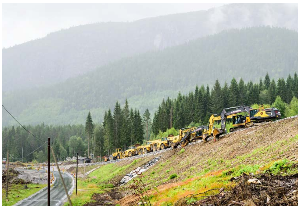
Veiarbeid i Bygland i Setesdal, Agder.

Teknologi trekkes fram som en av nøklene til det grønne skiftet og næringslivet framheves som en viktig aktør. Teknologioptimismen er stor, og omtrent halvparten av den norske befolkningen tror teknologiske nyvinninger vil løse klimaproblemene. Bransjer som utvikler teknologi og innovasjon er i stor grad fremdeles dominert av menn. Andelen kvinner i IKT-yrker i Norge har vært stabil på omtrent 23 prosent siden 2012 (SSB 2019). Ifølge OECD hindrer den lave andelen kvinner i teknologiutdanninger kvinners deltakelse i det grønne skiftet.