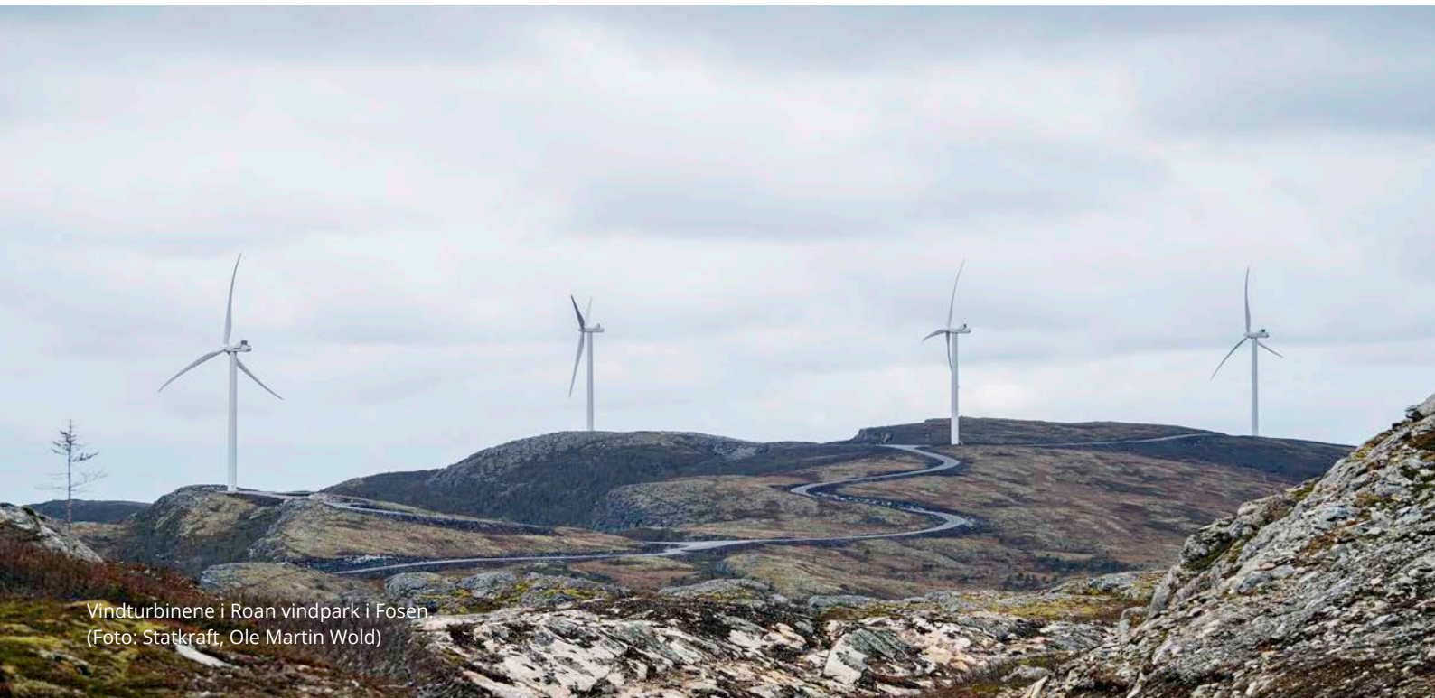
Vindturbinene i Roan vindpark i Fosen