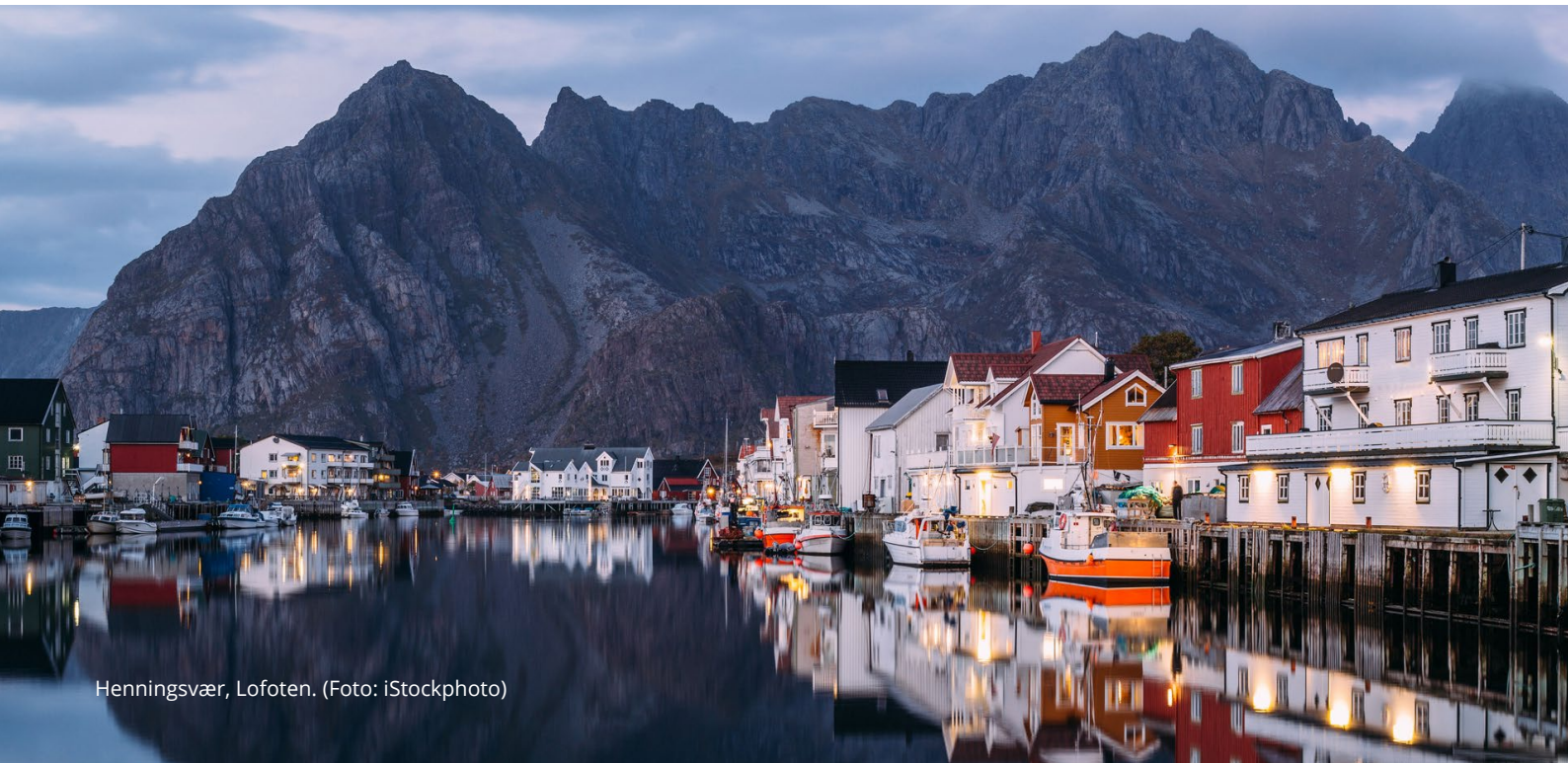
Henningsvær, Lofoten.